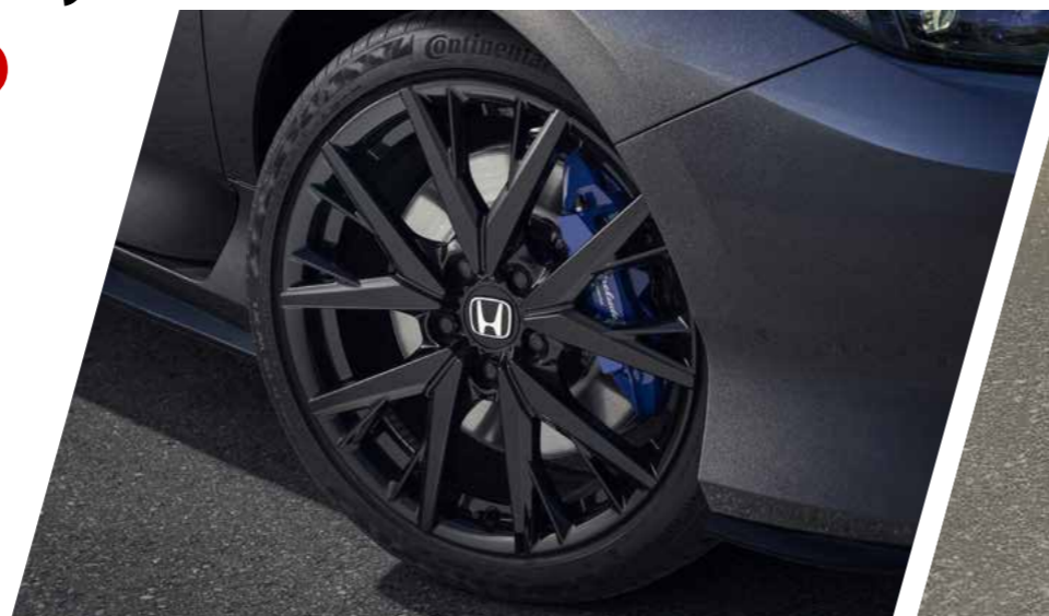
JANTES DE LIGA LEVE DE 19"