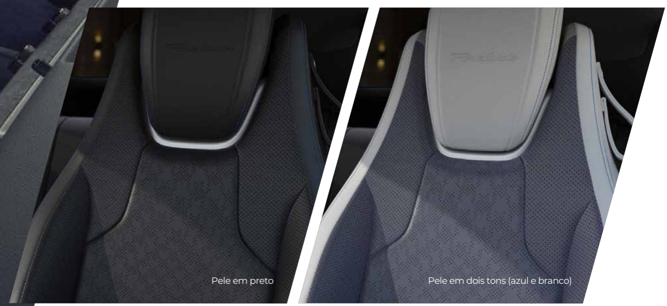
Pele em preto