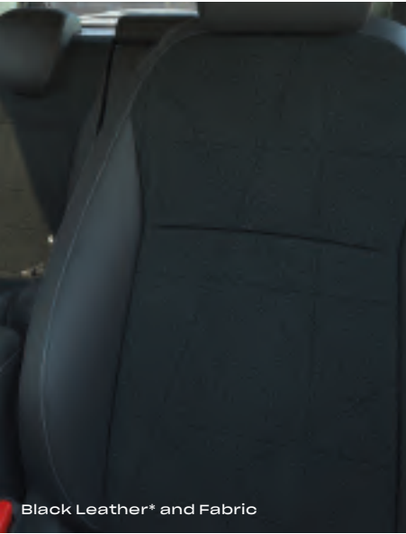
Black Leather* and Fabric