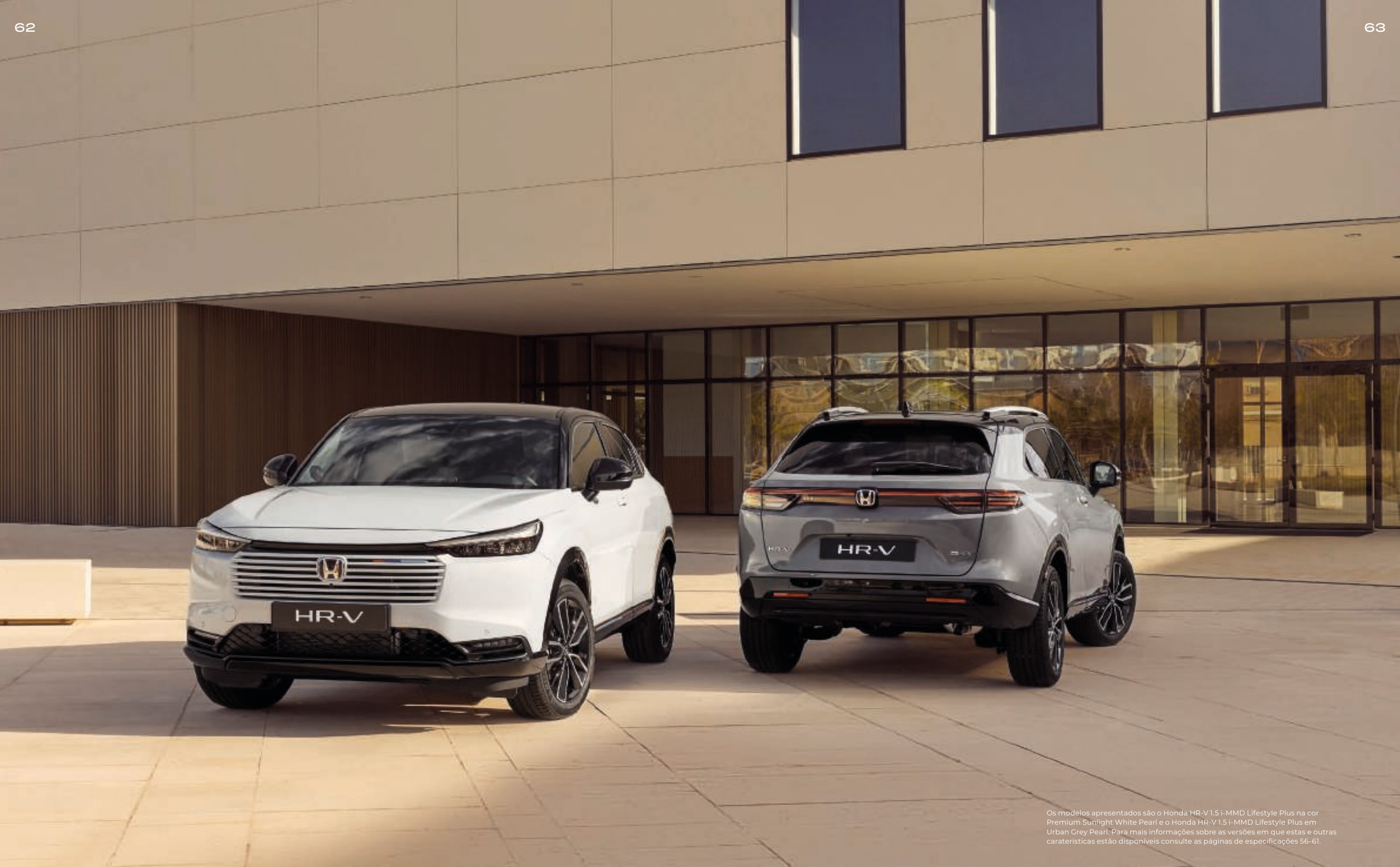
Os modelos apresentados são o Honda HR-V 1.5 i-MMD Lifestyle Plus na cor Premium Sunlight White Pearl e o Honda HR-V 1.5 i-MMD Lifestyle Plus em Urban Grey Pearl. Para mais informações sobre as versões em que estas e outras características estão disponíveis consulte as páginas de especificações 56-61.