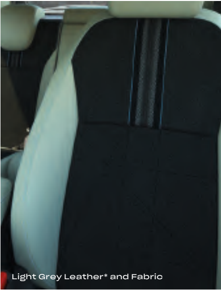
Light Grey Leather* and Fabric